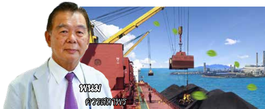
พนม ควรรตติภาพ

ในปี 64 อาจจะมีการปรับคุณสมบัติของลูกค้าใหม่ โดยจะเน้นไปที่กลุ่มที่มีรายได้ขั้นต่ำ 2.5-3 หมื่นบาทต่อเดือน จากเดิมที่กำหนดไว้ที่ 2 หมื่นบาทต่อเดือน หลังนี้ครัวเรือนในกลุ่มดังกล่าวปรับตัวเพิ่มขึ้น และธนาคารไม่ต้องการให้ลูกค้ามีการใช้จ่ายเกินตัว ●